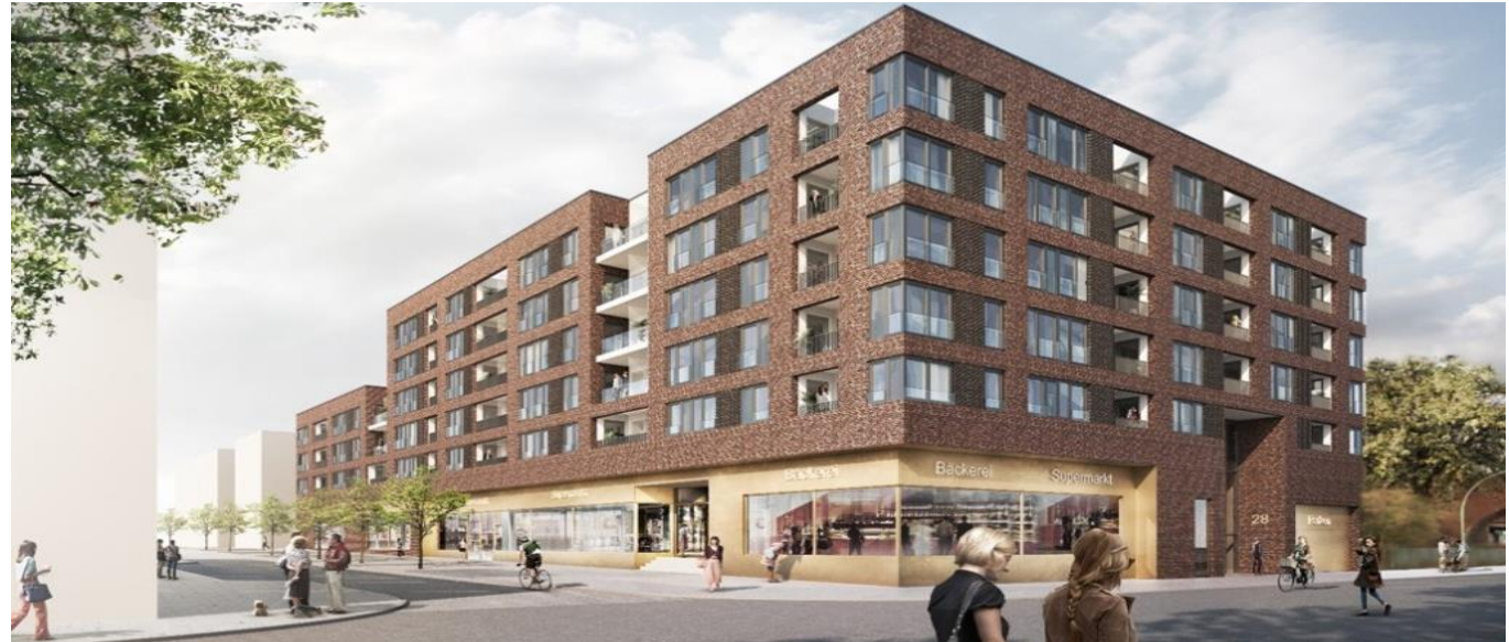
Abb. 1: Visualisierung der geplanten Wohnanlage mit Einzelhandelsflächen

Dr. Hesse & Partner Ingenieure Veritaskai 6 21079 Hamburg Tel: 040 - 52299190-0 www.dhpi.com